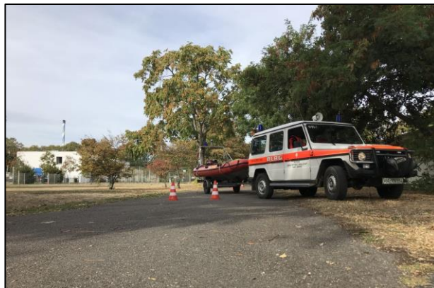
Fahrtraining unter anderem mit dem Bootgruppenfahrzeug und dem Motorrettungsboot 6/94-2.

Im Falle eines Einsatzes ist schnelles und sicheres Handeln gefragt. Nicht immer können wir auf die 'Neggarspitz' als unser größtes Boot zurückgreifen, welches ganzjährig im Rhein stationiert ist. Gelegentlich nehmen wir unser Material über den Landweg mit zu den Einsatzstellen. So befindet sich beispielsweise unser zweitgrößtes Boot mit dem Funknamen 6/94-2 stets einsatzbereit auf einem Trailer in unserer Geschäftsstelle.