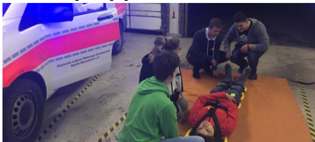
Das JET-Team bei einer Übung.

Außerdem lernen unsere JETies die Grundlagen der Ersten Hilfe, denn ein geretteter Patient muss direkt versorgt werden können. So erlernen die Jugendlichen unter anderem den Umgang mit dem Spineboard, den Zweck und die Anbringung eines Druckverbands, sowie den richtigen Umgang mit einem Verletzten.