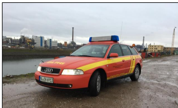
Der neue Kommandowagen

Es handelt sich bei dem Fahrzeug um einen Audi A4 aus dem Jahr 2001. Dieser ersetzt den bisherigen Kommandowagen, einen VW Passat mit dem Baujahr 1994, welcher im Jahr 2010 von Feuerwehr Mannheim übernommen wurde und den bis dahin genutzten Opel Kadett Kombi abgelöst hatte. BP